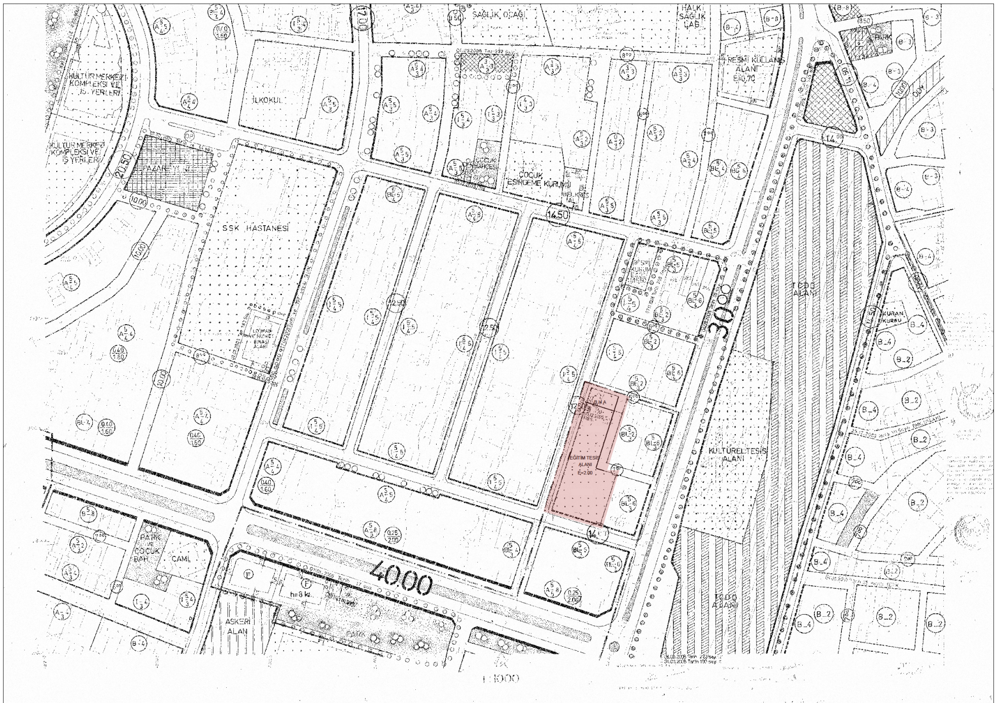
Belediye Meclisinin 03.06.2013 tarih ve 388 sayılı kararı ile onaylanan 1/1000 ölçekli Uygulama İmar Planı değişikliği