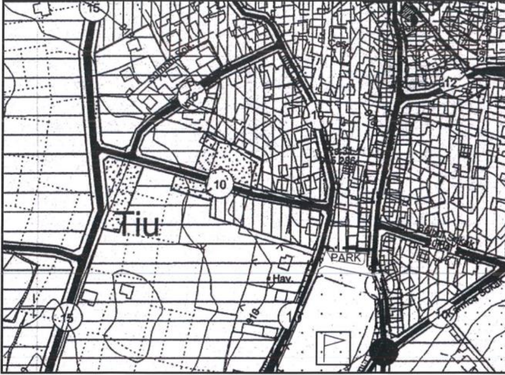
Mer'i Nazım İmar Planı Ö:1/5000